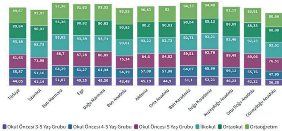
Bölgelere Göre Net Okullaşma Oranları, MEB

Ancak okul öncesi eğitimin zorunlu eğitim kapsamında olmaması ve bu uygulamaların sürdürülebilirliği konusu tartışmaya açıktır. Örneğin, okul öncesi eğitim yaşında olup çeşitli nedenlerle okul öncesi eğitime erişemeyen dezavantajlı bölgelerdeki çocuklara hazırlanan ve çocukların sosyal, duygusal, bilişsel, dil ve motor gelişimini desteklemeyi amaçlayan oyun merkezli bir set olan “Benim Oyun Sandığım Seti” MEB yetkililerinin tespit ettiği ailelere ulaştırılarak okul öncesi eğitimde fırsat eşitliği sağlamayı amaçlamaktadır. Set 365 gün için belirlenmiş eğitim içeriği ve programı içermektedir. Ancak bu setin uygulanması ebeveyn kontrolünde gerçekleştirildiği için ebeveynin de gerekli donanımına sahip olması beklenmektedir. Bu durum okul öncesi eğitimin etkili bir şekilde tüm çocuklara ulaştırılabilmesi için daha kapsamlı bir şekilde çocukları, öğretmenleri, okul yöneticilerini ve ebeveynlerini de içine alacak bir düzenleme yapılması gerekliliğini doğurmaktadır.