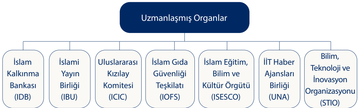
Şekil 2: İslam İşbirliği Teşkilatı Uzmanlaşmış Organları

projeye destek vermiştir ve bunların yaklaşık %30'u sosyal politikalara denk gelmektedir (IDB, 2019, s. 13). İKB'nin "üye devletlerin ve Müslüman toplulukların ekonomik kalkınmasını ve sosyal ilerlemesi" İslam'a uygun bir şekilde "bireysel ve toplu olarak teşvik etme" amacı bunun için yeterli bir dayanaktır (OIC, 25.11.2020). Böyle bir amaç, pekâlâ afet dönemi ve özelde COVID-19 için de uygulanabilir düzeydedir. Bu bağlamda, doğal afetlerden etkilenen İran'a, Sierra Leone'ye, Mozambik'e ve Mali'ye yapılan 1 milyon $'lık destek bulunmaktadır (IDB, 2019, s. 14). COVID-19 özelinde de virüsün etkisini hafiflet-