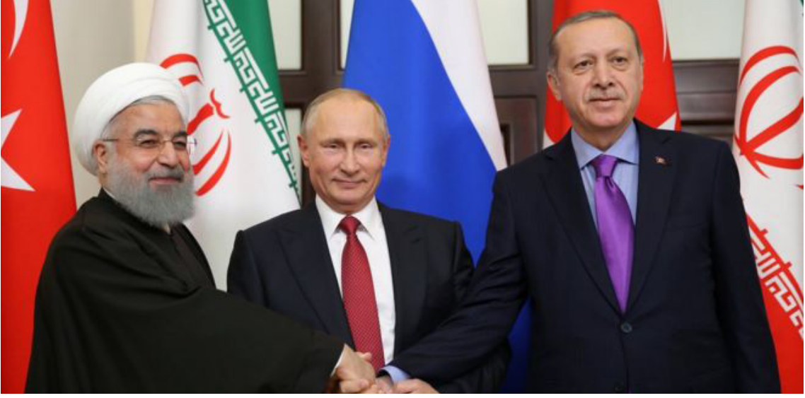
Soçi Zirvesi'nde biraraya gelen Türkiye, Rusya ve İran devlet başkanları Suriye'nin geleceğine dair önemli kararlar aldı.

Kaynak: http://www.bbc.com/turkce/haberler-dunya-42079600/ 22 Kasım 2017